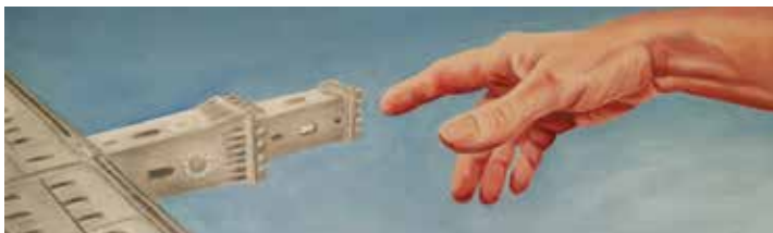
Grünflächenamt, gesehen von Ingrid Riedl (Ausschnitt)