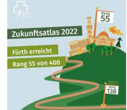
Illustration: Stadt Fürth, Grafik