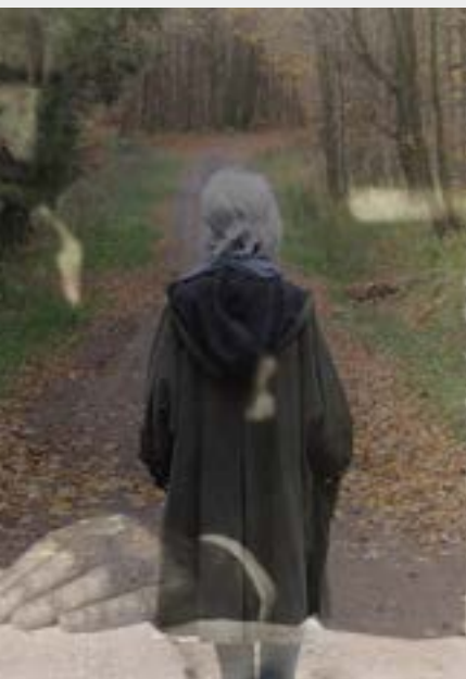
...sst sich auf Wassermanns Spuren wandeln.

Künstler: Şehbal Şenyurt Arınlı (Literatur), Maja Bogaczewicz (künstlerische Leitung, Malerei/Design).