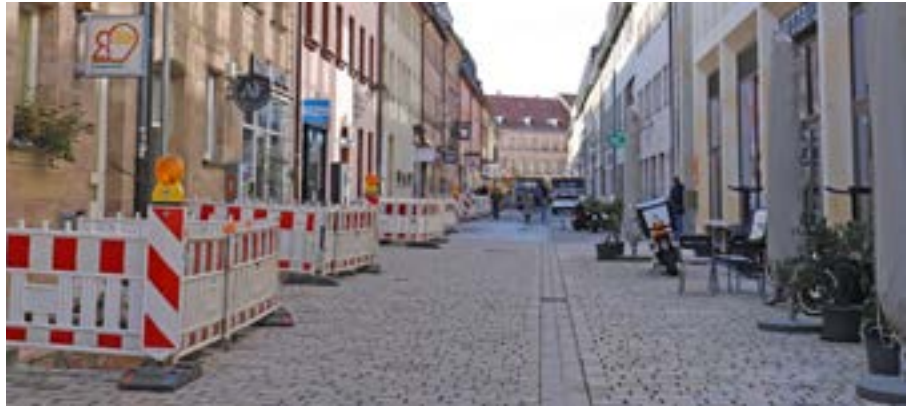
Die Alexanderstraße zwischen der Schwabacher Straße und Hallstraße soll optisch aufgewertet werden.

Ziel ist es außerdem, die Aufenthaltsqualität im gesamten Bereich deutlich zu steigern. So wird die Straße mit Granitsteinen gepflastert, drei neue Bäume und privates Grün an den Fassaden sorgen zusätzlich für eine optische Aufwertung und zum Verweilen lädt eine der beiden bereits platzierten Grünen Bänke ein. Zudem verbessern Radabstellanlagen und zwei Parkmög-