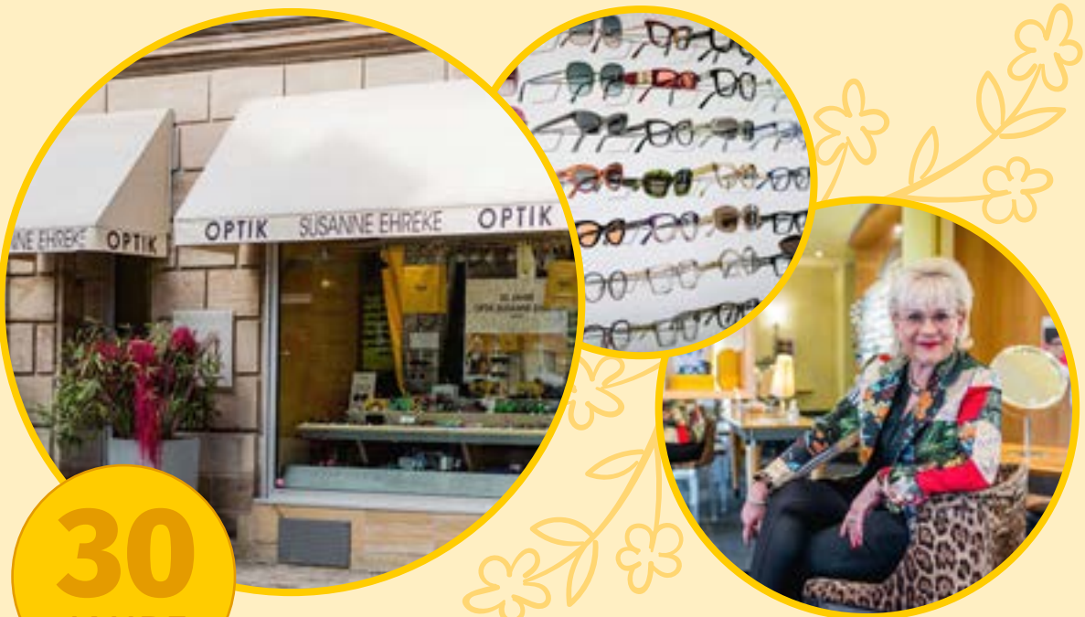
Illustrationen: Freepik

Innenstadthandel betreiben ist eine Kunst für sich – jahrzehntelang erfolgreich sein, bedarf einer gehörigen Resilienz. Umso schöner, dass die Kleeblattstadt sich derzeit gleich über drei runde Geburtstage freuen kann.