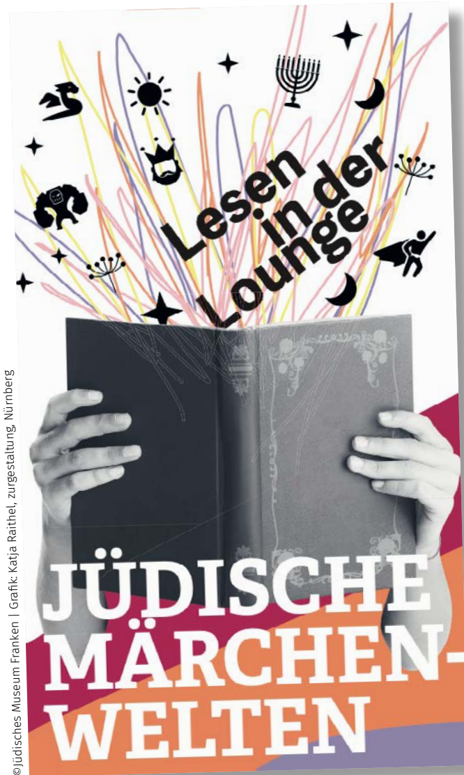
Grafik: Katja Raithel, zugestaltung, Nürnberg