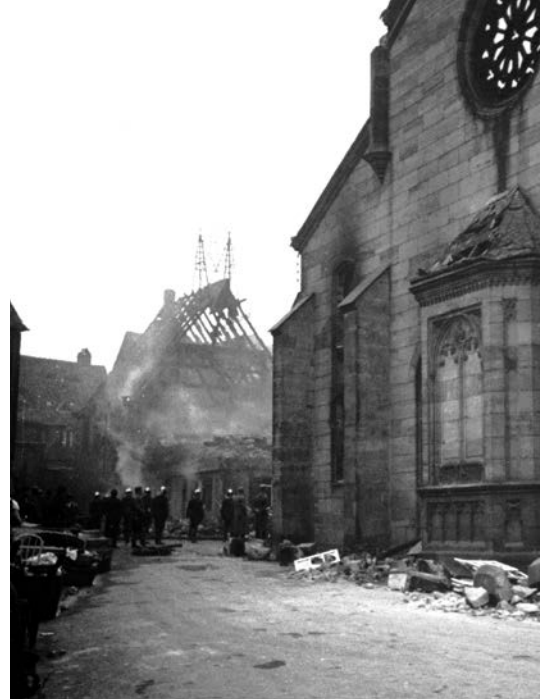
In der Reichspogromnacht zerstörten die Nationalsozialisten auch die Synagoge in der Geleitgasse.

Alle Bürgerinnen und Bürger sind zu dieser Gedenkfeier herzlich eingeladen. ●